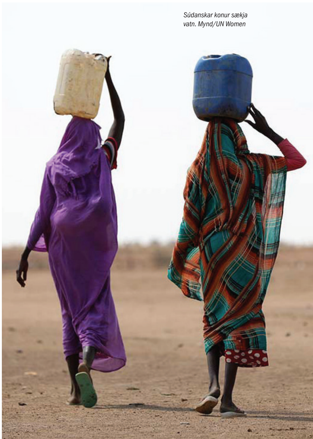
Súðanskar konur sækja vatn.

Heildarframlag stjórnvalda til verkefna UN Women 385.480.000