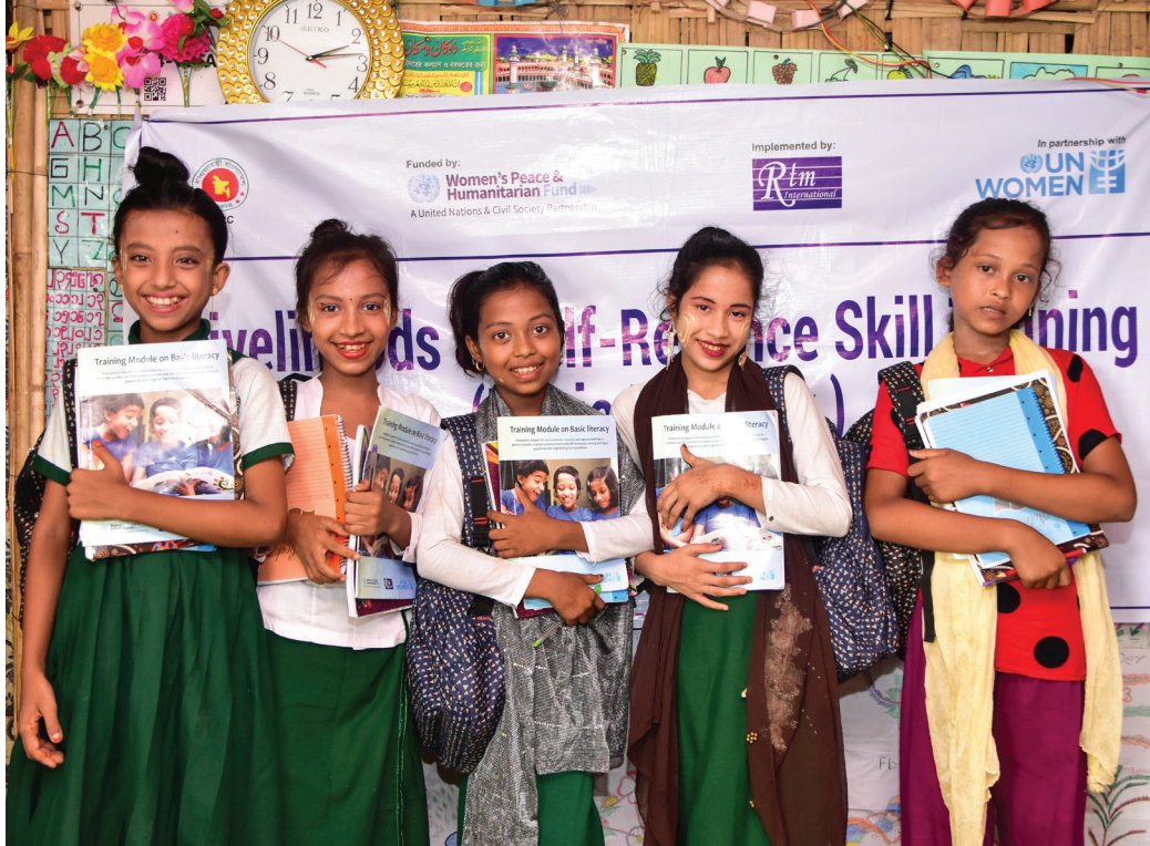
Róhingja stúlkur sækja námskeið á vegum UN Women í Cox 's Bazar flóttamannabúðunum í Banglades.