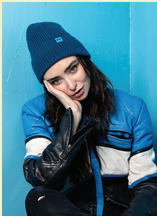
FO-herferð UN Women á Íslandi studdi við verkefni í Súdan.

Sala á FO-húfunni 2024 aflaði 8.118.170 króna til verkefna UN Women í Súdan. Fjármagnið mun styðja við um 280 fatlaðar konur á flóttu í Kassala-héraði í Súdan.