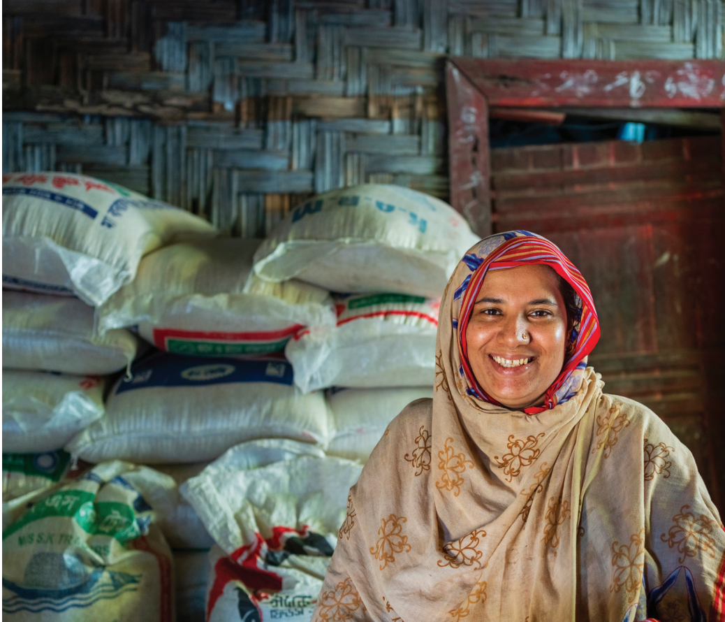
UN Women styður við atvinnusköpun Róhingja kvenna í Cox's Bazar flóttamannabúðunum í Bangladess.