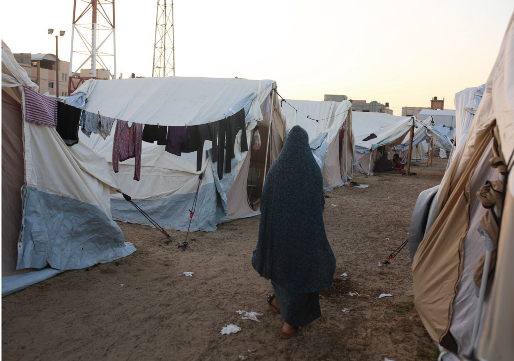
Palestínsk kona gengur í gegnum flóttamannabúðir í Gaza.